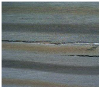
Abb.1 Rissbildung innerhalb Ag935 Lage

Bei Überbeanspruchung des Materials kommt es daher in der Regel zu Brüchen innerhalb der Legierungen Gg917 oder Ag935 wie auf den Abbildungen zu sehen ist. Brüche in der Palladiumlegierung sind eher selten der Fall.